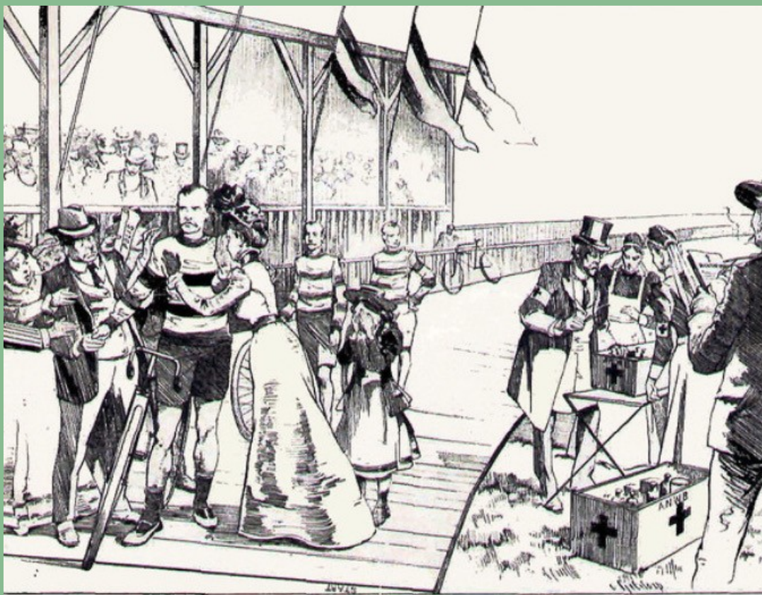
Corsa ciclistica, disegno, 1901