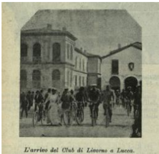
L'arrivo del Club di Livorno a Lucca.

Un'altra traccia della presenza femminile agli albori del ciclismo labronico la troviamo negli echi apparsi sulla stampa del Raduno ciclo - automobilistico svoltosi a Lucca il 13 settembre 1903. Nonostante la giornata di pioggia al raduno partecipano circa 500 persone "fra cui alcuni automobilisti" . Da Livorno arrivano a Lucca gli aderenti al "Club Ciclistico Livornese" , con la fanfara sociale, rigidamente in bicicletta, naturalmente. Fra le foto pubblicate su "La Stampa Sportiva" del 29 settembre c'è anche quella che immortalava l'arrivo dei ciclisti livornesi, con in prima fila, una donna.