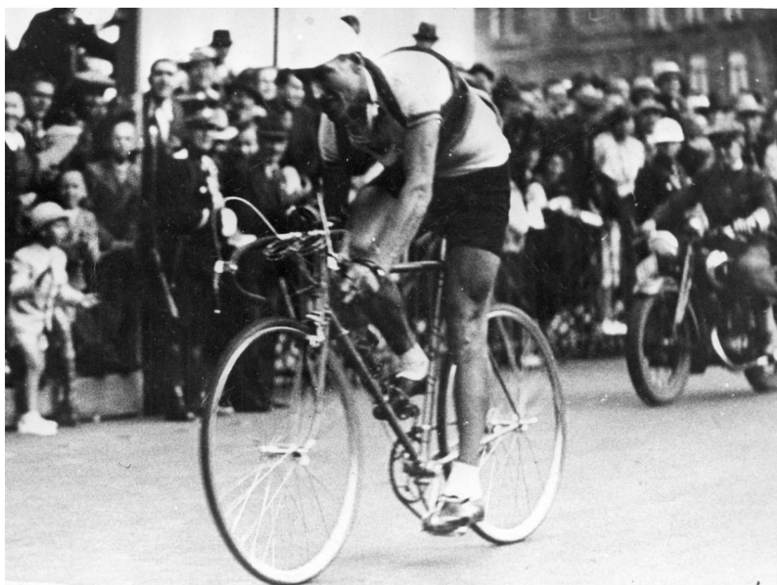
Sotto: Kint vince con la maglia di campione del mondo la Paris – Roubaix del 1943