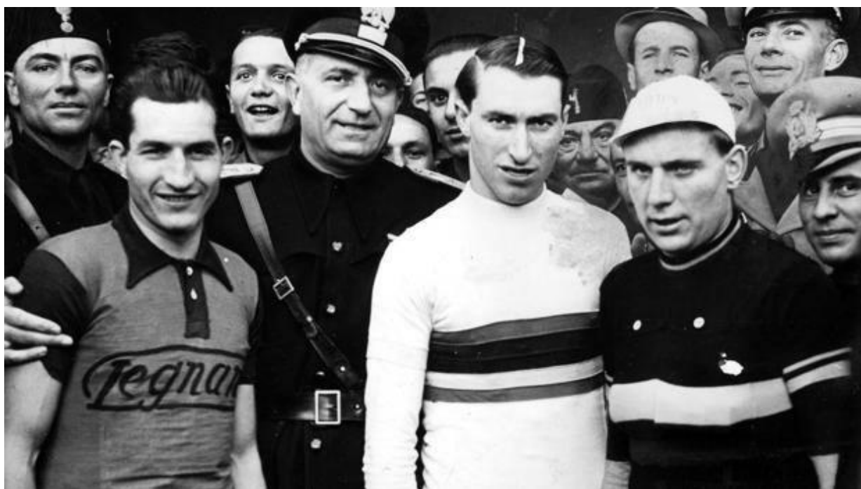
Sopra: Kint in maglia iridata con Bartali e con l'immane - siamo in Italia - gerarca fascista in divisa della milizia. Non siamo riusciti ad identificare il corridore alla destra di Marcel Kint.