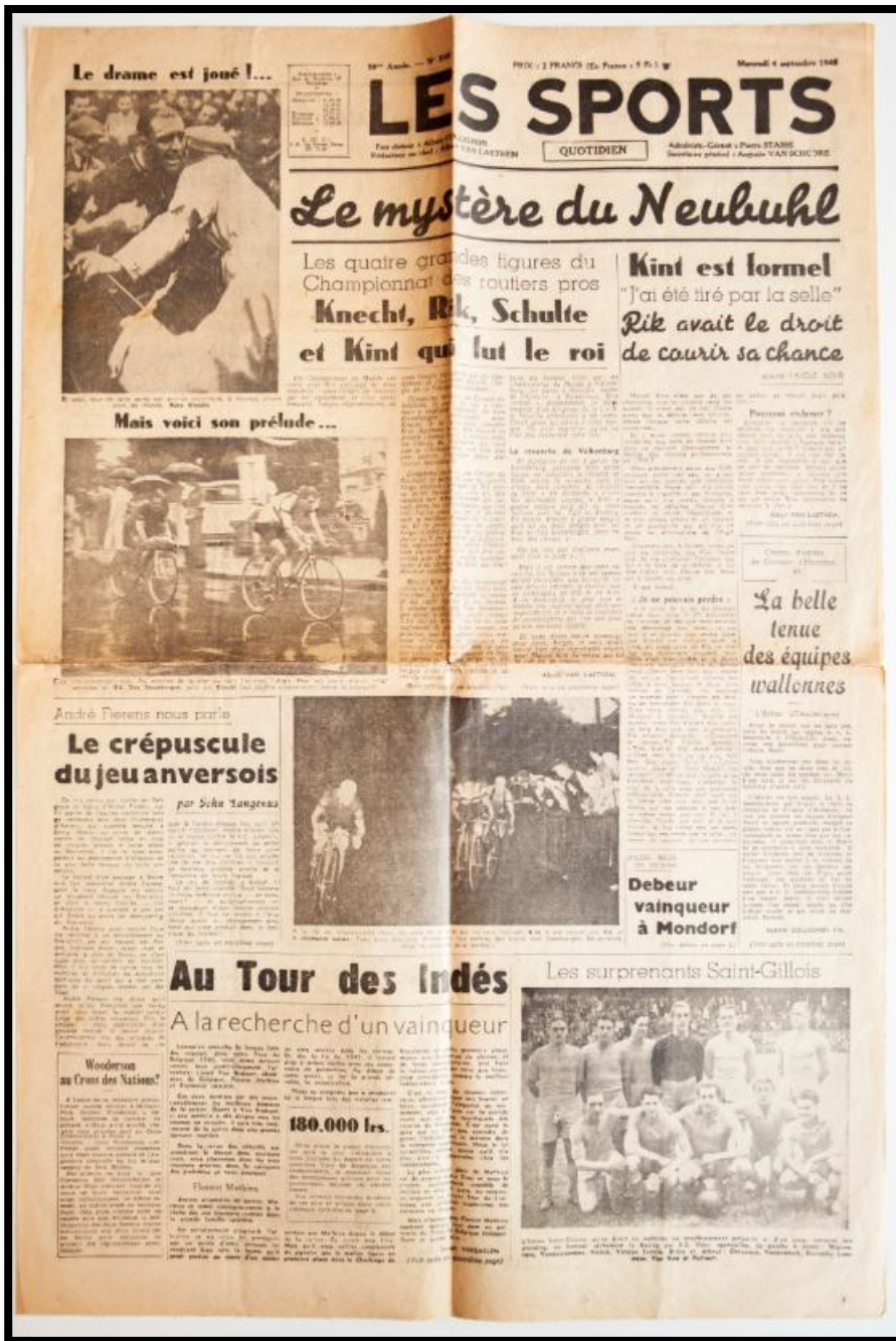
La prima pagina del quotidiano sportivo belga "Les Sports" del 4 settembre 1946 che giustifica la corsa di Van Stembeergen.