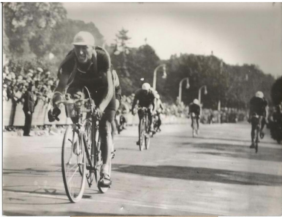
Tour 1938, Kint vince la tappa con arrivo a Metz