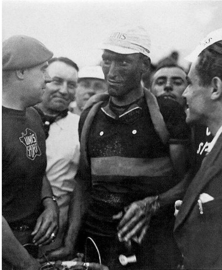
“Aquila nera” Kint al Tour de France 1938