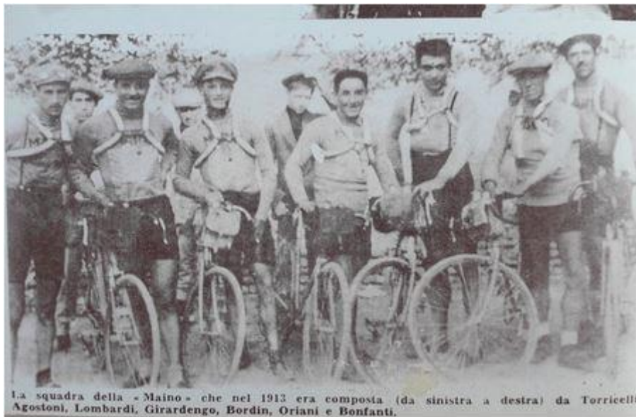
La Maino 1913

Le foto se non diversamente indicato sono state tratte dalla rete. Eventuali titolari di diritti lo segnalino: se lo desiderano inseriremo il loro nome oppure provvederemo a rimuoverle.