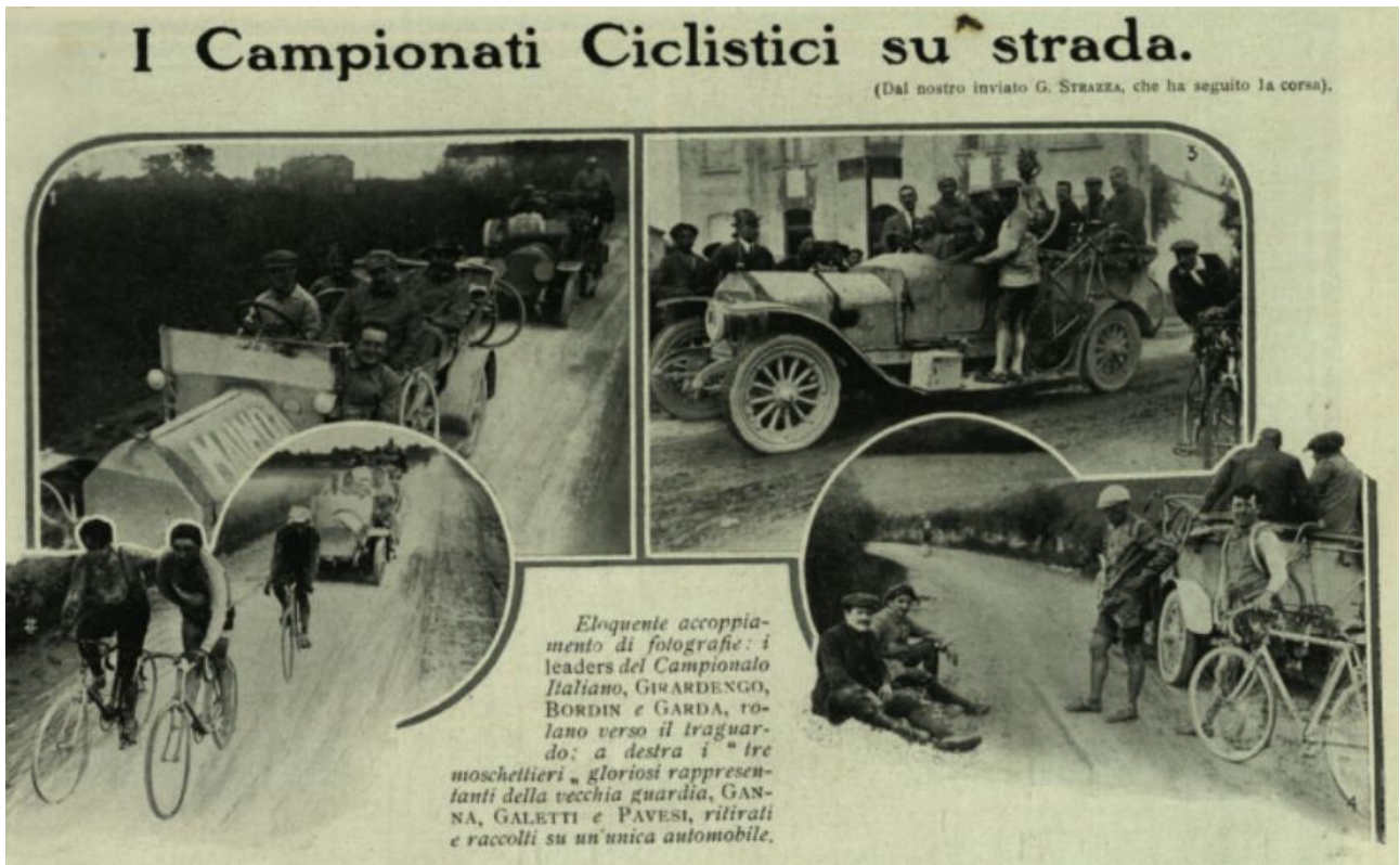
Ancora foto dei campionati italiani 1913