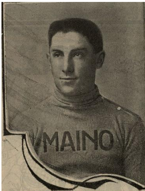
Girardengo nel 1913 (Fonte: La Stampa Sportiva).