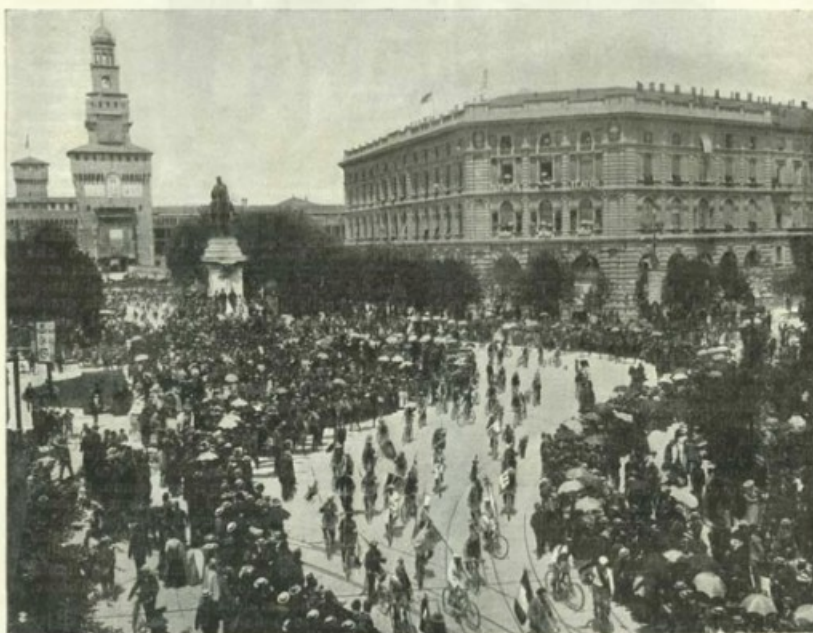
La sfilata: il gruppo degli stendardi al monumento di Garibaldi