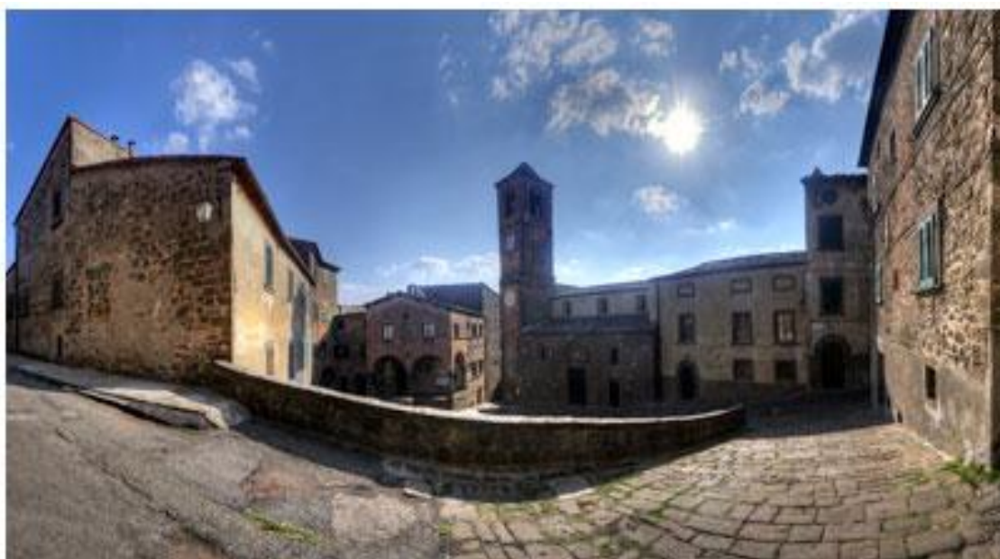
Montecatini val di Cecina

Note – Il giro è piuttosto impegnativo e richiede un ottimo gradi allenamento. La salita più impegnativa è quella che di Montecatini VdC che comunque non comporta difficoltà particolari anche per chi non è particolarmente portato alle "montagne". Il dislivello complessivo è di circa 1120 metri. Un ciclamatore sufficientemente allenato può compiere questo percorso in circa 5 ore/ 5 ore e mezzo.