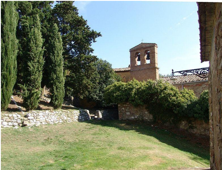
Il campanile della chiesa di Gello intitolata a S. Lorenzo

Siamo di nuovo sulla "Salaiola". A Ponteginori, proprio nel centro del paese, si svolta a sinistra, si supera il passaggio a livello della vecchia ferrovia che collega Cecina a Volterra, e ci si dirige in direzione Bibbona. Qui la strada torna ad essere un "mangia e bevi" molto più impegnativo di quello incontrato all'inizio dell'uscita (si arriva anche poco sotto quota 100 mt). Superata località Molino del Muflone si incontra la strada che porta da Casino di terra a Canneto ma si "tira a dritto" verso Bibbona affrontando la seconda asperità della giornata. Niente di eccezionale questa salita che ha il suo tratto più impegnativo – pendenza attorno al 9% - al bivio per Guardistallo. Dopo la salita ecco una veloce e bella discesa verso Bibbona e da qui verso Cecina imboccando la SP detta del "Paratino". Alla rotatoria dell'ospedale siamo ad un km dal centro della cittadina.